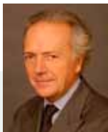
E. Carmignac Gestor

Una gestión internacional de convicción centrada en la búsqueda de una rentabilidad máxima