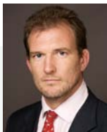
S. Pickard Gestor

La experiencia de Carmignac para captar las auténticas oportunidades del mundo emergente